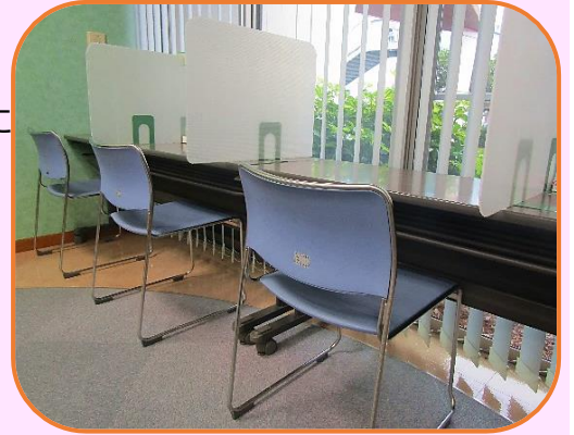
学習コーナーは、ひと席ずつ パーティションで区切っております